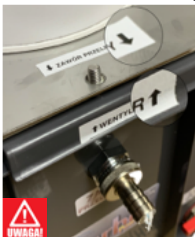
Rys.2 Prawidłowe zamocowanie pokrywy zbiornika (opcja)